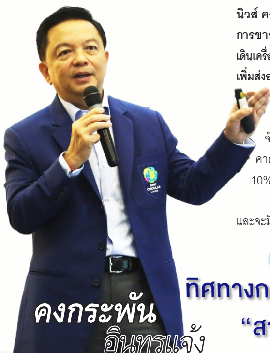
คองกระพั้น อินทรแจ่ง

นิวส์ คอนเน็คท์ – PTTGC มั่นใจปีนี้ปริมาณการขายเติบโต 10% ตามเป้าได้ 3 โครงการเดินเครื่องปีนี้ ลุ้นโรคระบาดโควิด-19 จบไตรมาส 2/63 เพิ่มส่งออกเอเชียตะวันออกเฉียงใต้